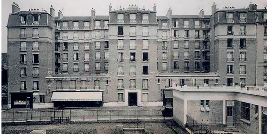
CLICHY-sur-SEINE — Maisons d'habitations à bon marché, rue Simonneau. Deux immeubles semblables construits par l'Office Public d'H. B. M. en collaboration avec l'ASSEMBLEE MUNICIPALE de CLICHY - 1925-1929.